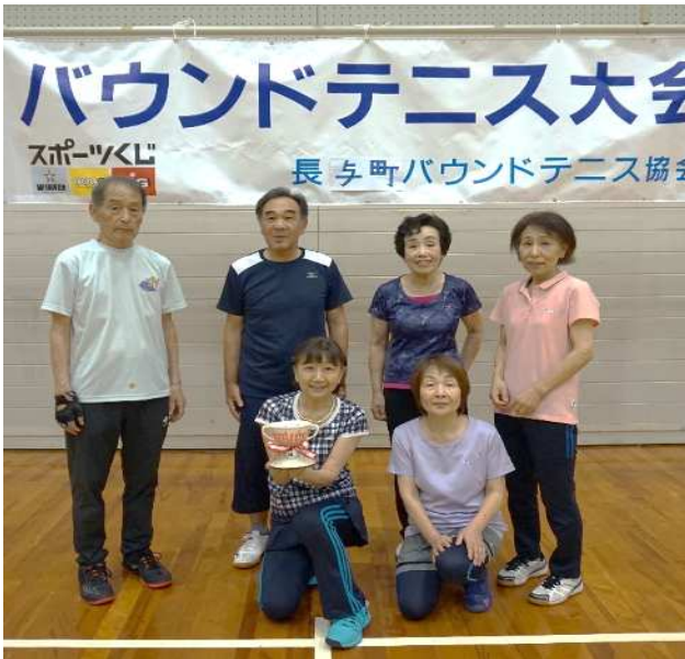
優勝 サルビア チーム