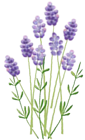
敢闘賞 アイリス チーム & コリ チーム